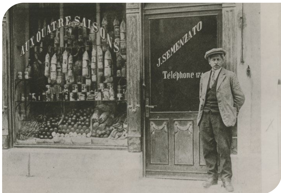
1920 — Magasin Samenzato à la rue Centrale