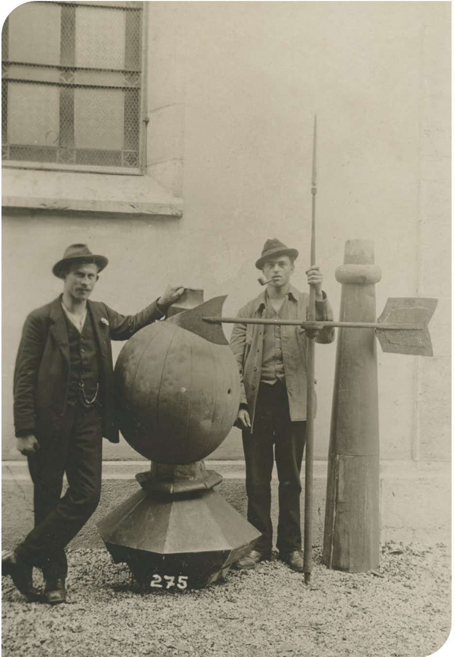
1921 — Flèche de la collégiale