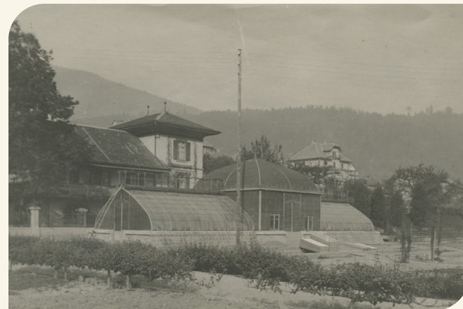
Serres de la Condemine