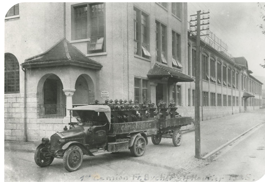
1925 – Transports F. Bucher